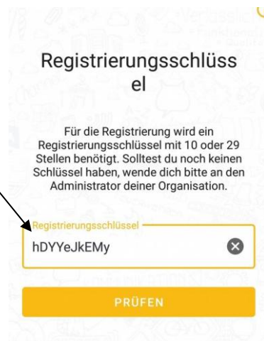
Beispielfoto. Ihr Schlüssel wird anders sein.

3. Lesen Sie die Nutzungsbedingungen und akzeptieren sie diese.